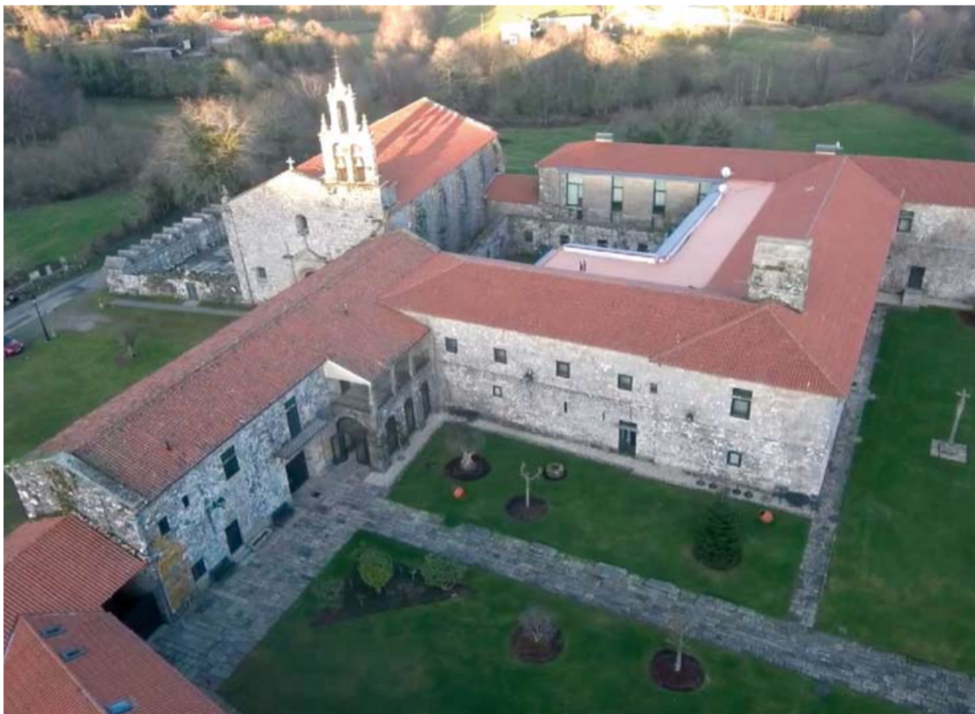
Mosteiro de Acibeiro e lagoa Sacra de Olives.